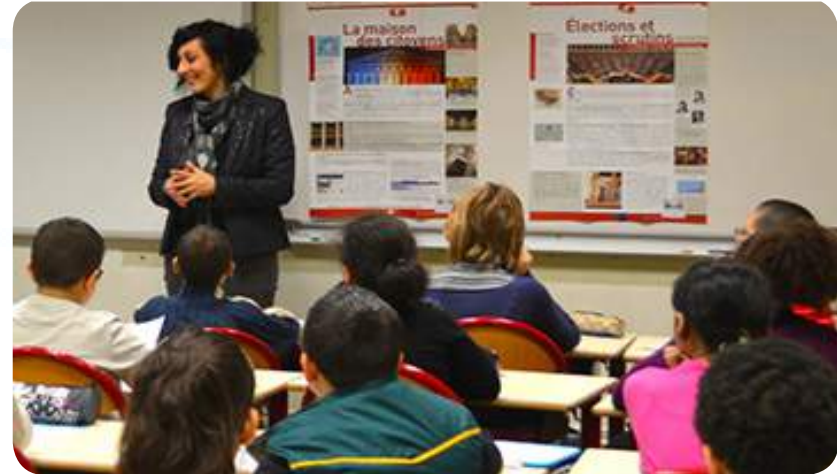
Animation d'un débat sur le rôle de la citoyenneté

« Soyez le changement que vous souhaitez voir dans le monde »