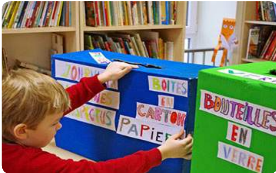
Sensibiliser au recyclage