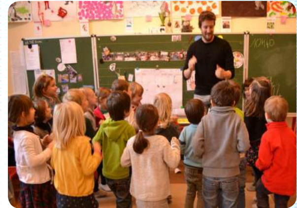
Faire découvrir une danse africaine