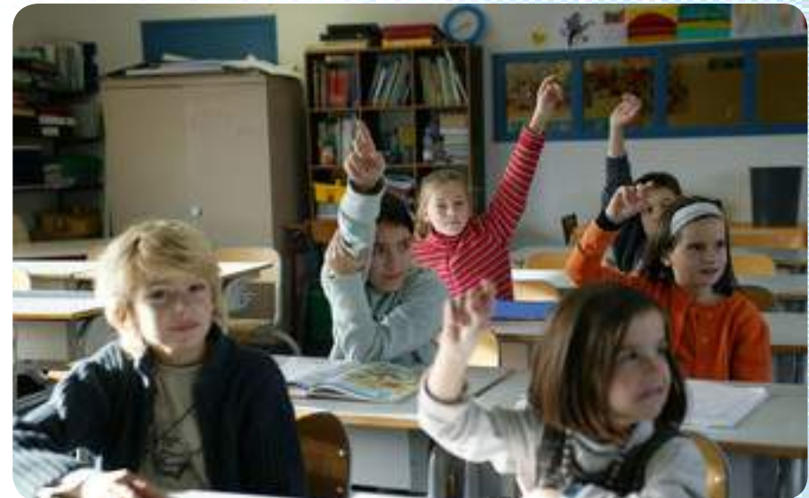
Susciter le questionnement

Possibilité de visite d'association oeuvrant pour la résolution de tel ou tel défi planétaire.