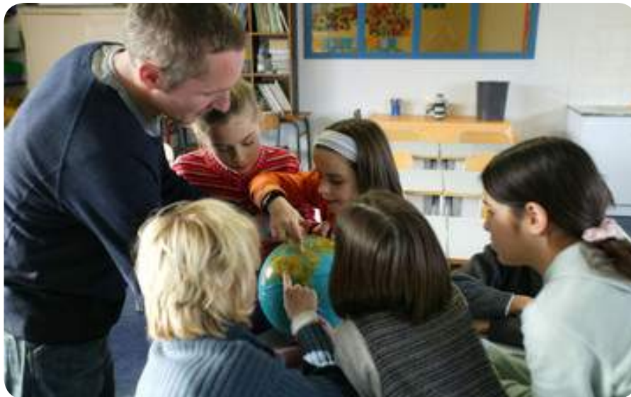
Donner envie de découvrir le monde de ses propres yeux