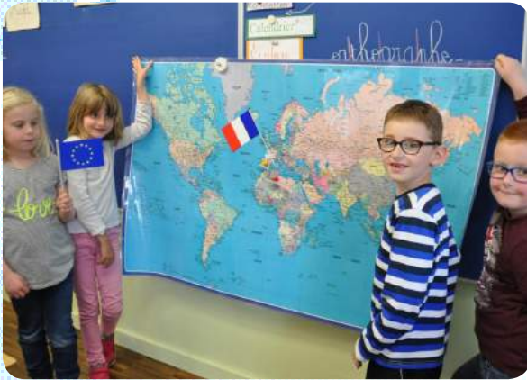
Découvrir le monde au-delà de nos frontières