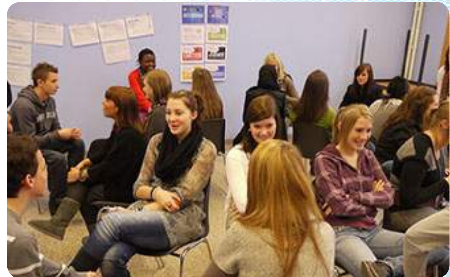
Apprendre à s'écouter pour bien se connaître