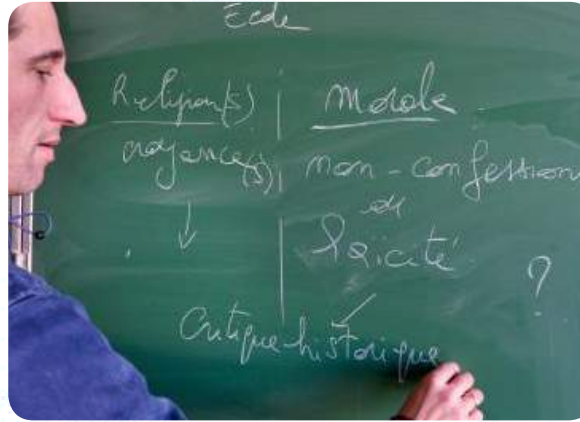
Comprendre la laïcité